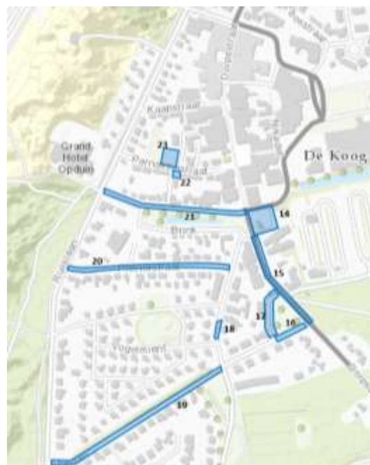
Figuur 10 Parkeersecties deelgebied 2

Om de bezettingsgraad te berekenen is het van belang om de capaciteit van de parkeerplaatsen en woonstraten inzichtelijk te maken. In onderstaande tabel is de capaciteit van de veertien secties uit deelgebied twee weergegeven. De capaciteitstabel is tot stand gekomen in samenspraak met de gemeente Texel en daarnaast ter plaatse geverifieerd.