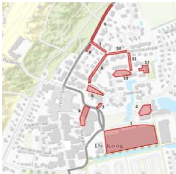
Figuur 2 Parkeersecties deelgebied 1

Om de bezettingsgraad te berekenen is het van belang om de capaciteit van de parkeerplaatsen en woonstraten inzichtelijk te maken. In onderstaande tabel is de capaciteit van de veertien secties uit deelgebied één weergegeven. De capaciteitstabel is tot stand gekomen in samenspraak met de gemeente Texel en daarnaast ter plaatse geverifieerd.